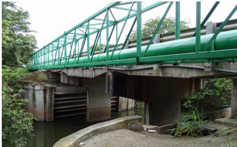
Tubería del acueducto de Nimboyores, septiembre 2018.

sean asumidos por trabajadores inmigrantes de origen nicaragüense dispuestos a cobrar salarios más bajos ha creado también malestar entre la población local (Navarro, 2013, 2014). En este contexto, no se construye un discurso contra el turismo si no que fundamentalmente se cuestiona los escasos beneficios generados por este modelo concreto y se aspira a un desarrollo turístico más inclusivo (Scheyvens & Biddulph, 2017), en el sentido de una mayor participación de los pobladores de las comunidades en términos tanto de posibilidades de desarrollar negocios propios vinculados al turismo como de mejorar la calidad de los empleos disponibles, o que pueda entroncar con la idea de steady state tourism , en el sentido de la necesidad de fomentar un crecimiento más cualitativo que cuantitativo (Hall, 2009, 2010).