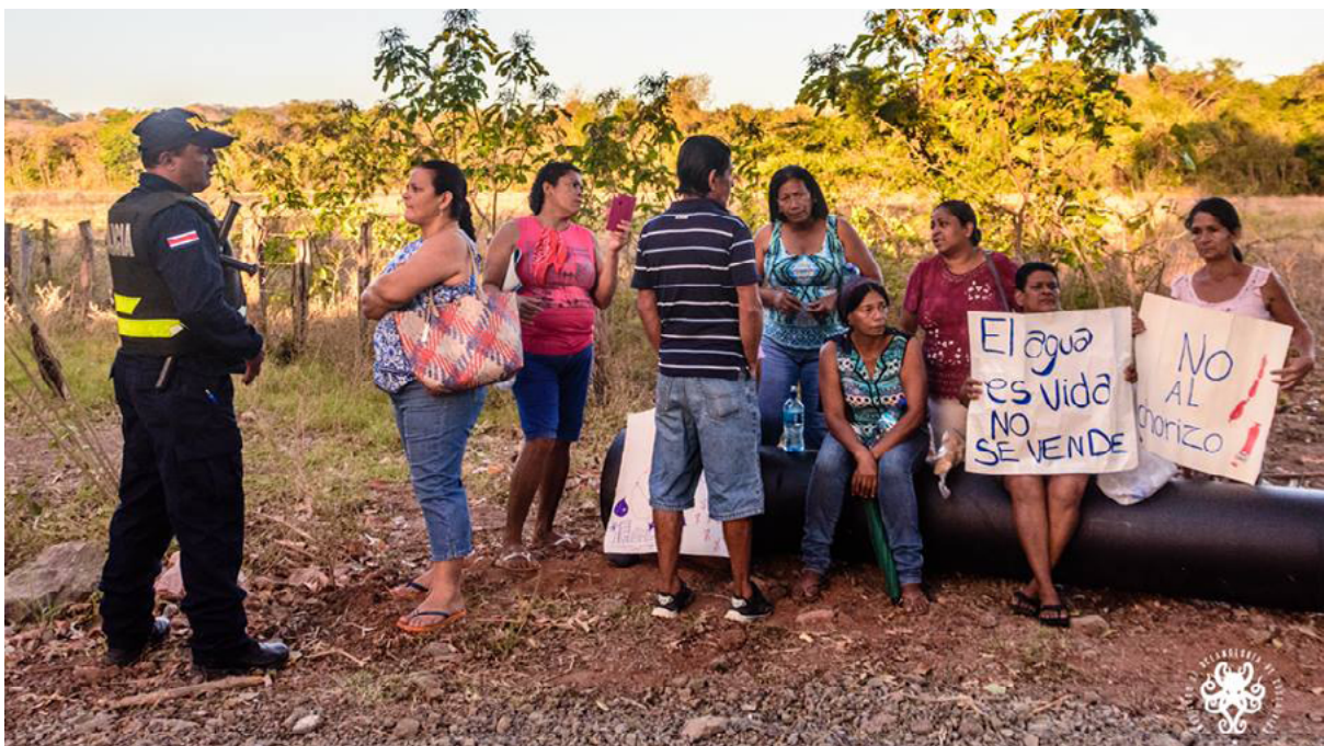
Protestas en la comunidad de Lorena por la construcción del acueducto de Nimboyores, febrero 2018. Imagen del Instituto de Oceanología de Costa Rica. Bajo licencia CC.

De este modo, los grupos comunitarios que han sostenido conflictos con desarrollos turístico-residenciales por el agua, de forma creciente se han visto confrontados por otros colectivos de población que defendían posiciones contrarias.