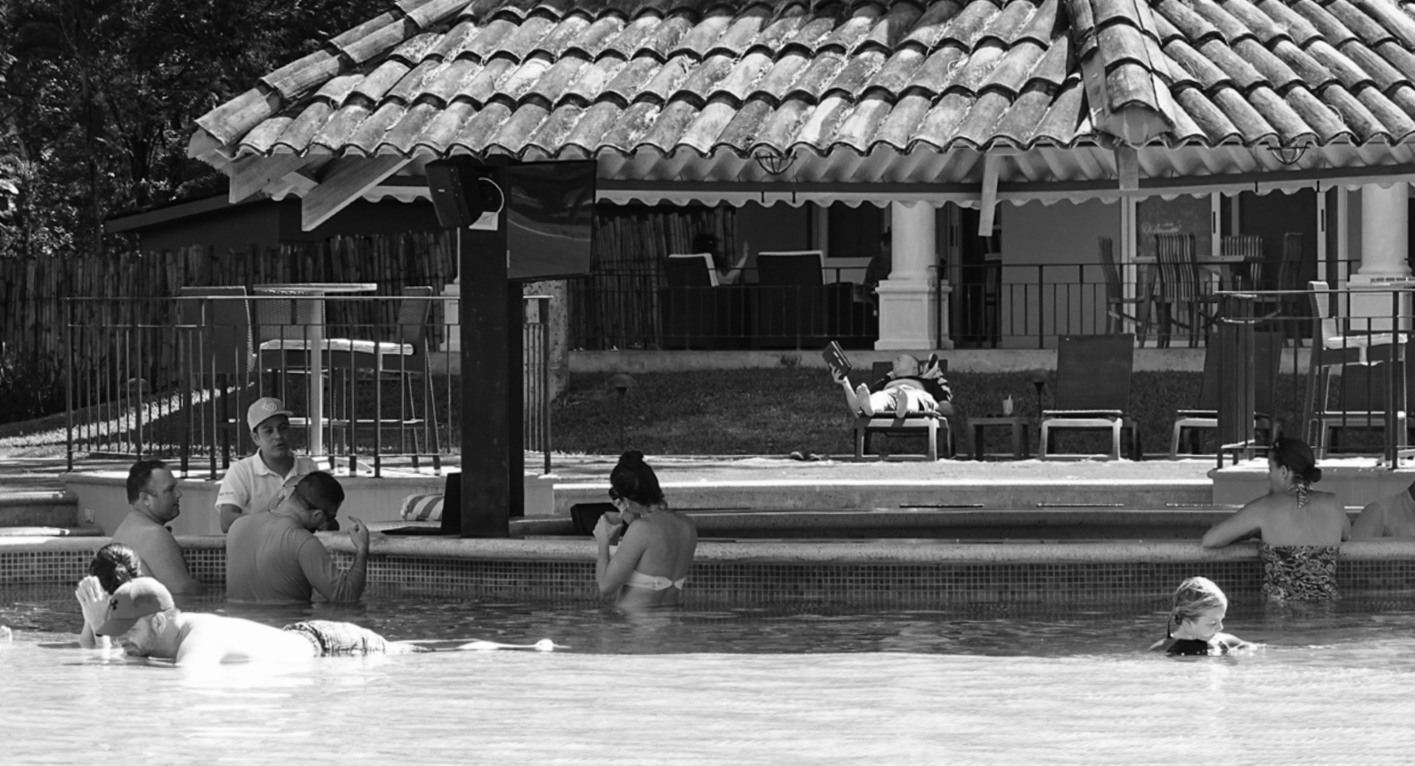
Imagen de Ernest Cañada / Alba Sud