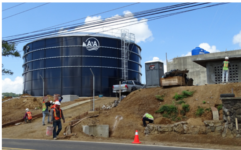
Construcción de tanque de almacenamiento de agua del acueducto Sardinal-El Coco, septiembre 2018.