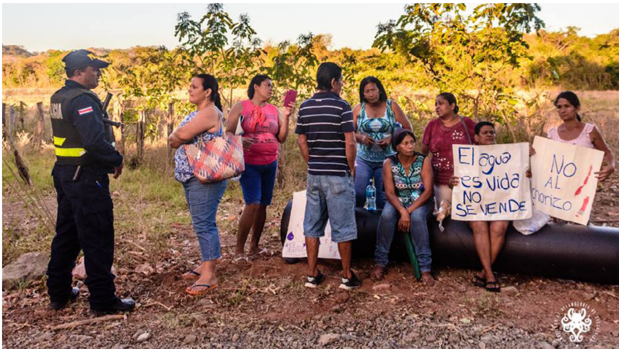
Protestes a la comunitat de Lorena per la construcció de l'aqüeducte de Nimboyores, febrer 2018. Imatge del Instituto de Oceanología de Costa Rica. Sota llicència CC.

D'aquesta manera, els grups comunitaris que han sostingut conflictes amb iniciatives turístico-residencials per l'aigua s'han vist confrontats, de manera creixent, per altres col·lectius de població que defensaven posicions contràries.