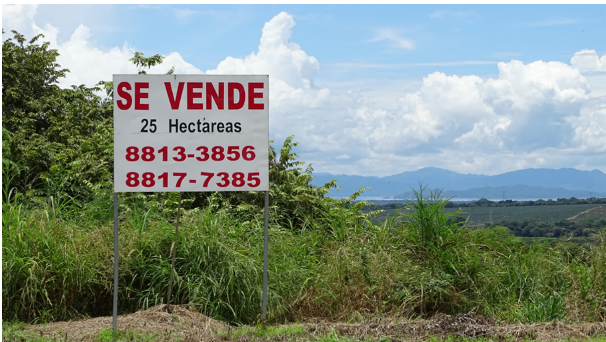
Imatge d'Ernest Cañada / Alba Sud.

El debat actual sobre el fenomen de l' overtourism pot ajudar a ampliar la preocupació i l'anàlisi de per què i com en determinats contextos el creixement turístic ha donat lloc a creixents manifestacions de malestar entre la població local com a resposta a lògiques excoents del desenvolupament turístic per part del capital. En l'àmbit rural aquesta perspectiva ha estat menys analitzada, però pot ser un marc d'interès per poder interpretar certes reaccions de grups comunitaris davant el desenvolupament turístic.