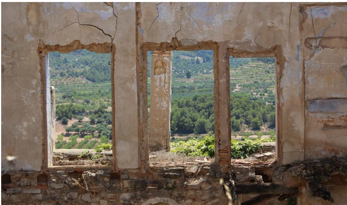
Poble Vell de Corbera.

Malgrat les dificultats per tractar els fets d'una manera respectuosa i sense banalitzar-los, és fonamental la tasca que fan les associacions i empreses com Terra Enllà o el