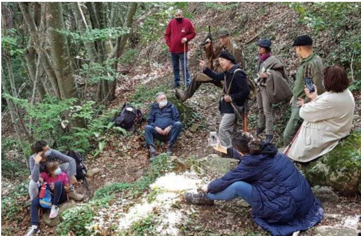
Ruta maquis.