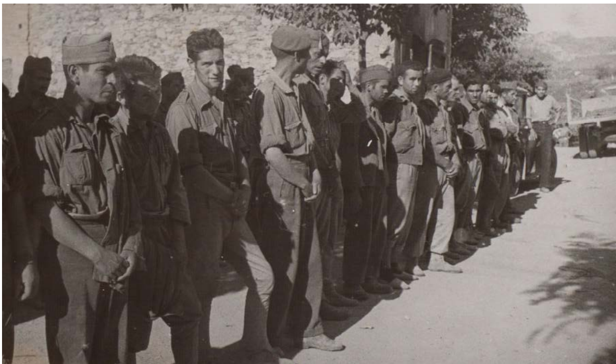
Ofensiva de l'exercit republicà a l'Ebre. Juliol o agost del 1938.

També defensen, atribuint més o menys legitimitat als colpistes, que un suposat caos social i violència política creixent durant els anys de la República explicaria com a una conseqüència gairebé natural el cop militar i la posterior guerra.