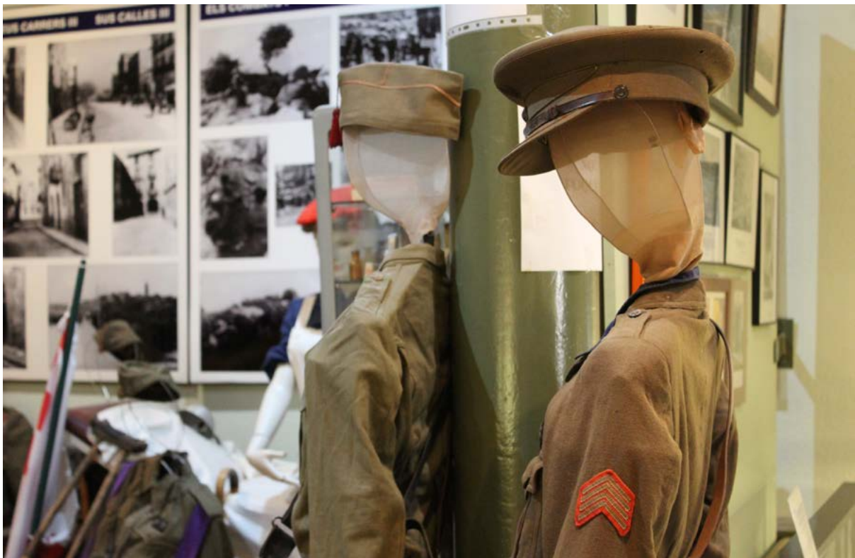
Museu la Trinxera, Corbera d'Ebre.

L'equip de Terra Enllà coincideix amb la dificultat de ser atractius per la gent més jove. L'Andreu Caralt assenyala la importància que té en això el factor temps, i afirma que “juga en contra, ja que un dels actius més importants, els supervivents, s'han perdut”, i això implica que, en termes generals, “les generacions d'avui han perdut el vincle emocional” . Per aquest motiu, van incloure una ruta en kayak al seu catàleg, per tal de cridar l'atenció de famílies amb infants i jovent. A més, aprofiten per fer conscienciació de la problemàtica ambiental al riu Ebre.