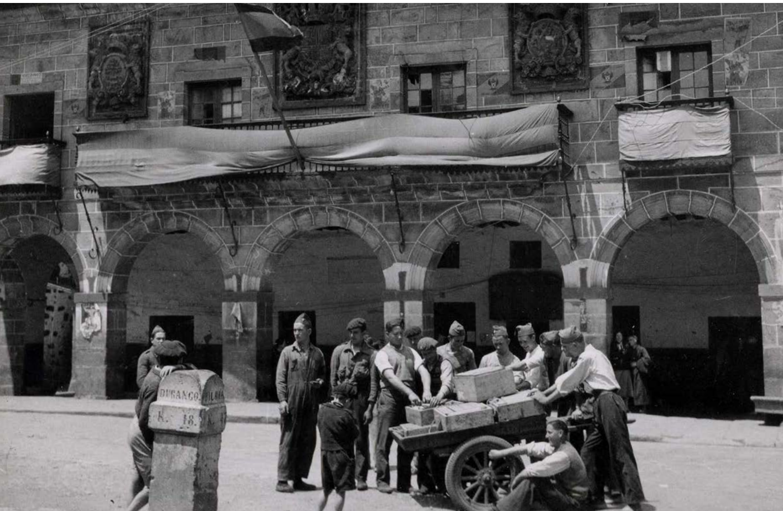
Durango, Vizcaya, entre el 1936 i 1939.

Weiss, P. (2003 [1975]). La Estética de la Resistencia . Hiru.