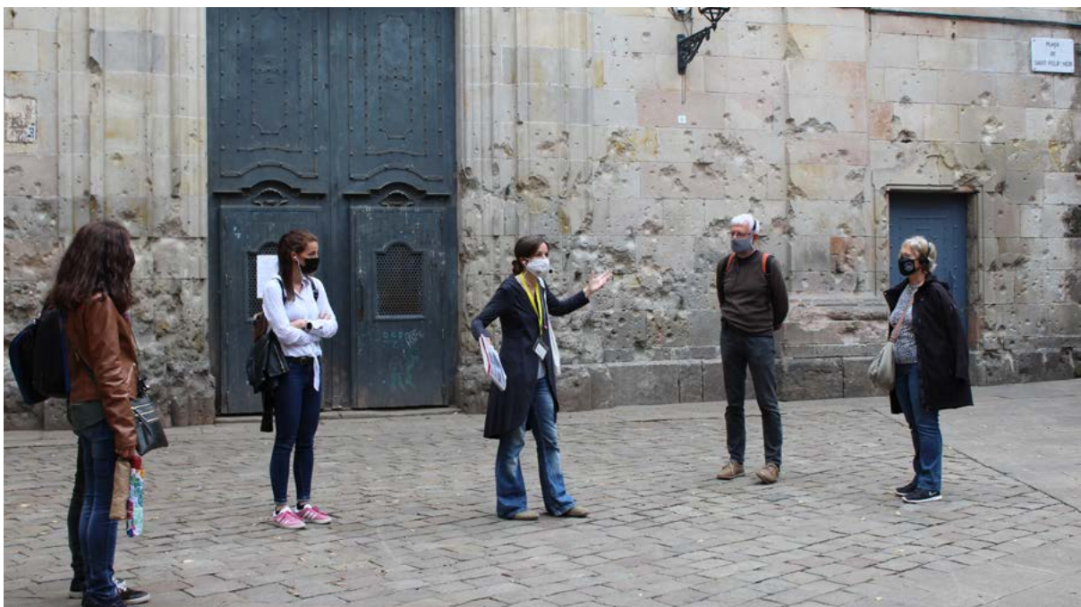
Cultruta. Ruta guiada sobre la Guerra d'Espanya.

A alguns països d' Amèrica Llatina , on la reivindicació de veritat, justícia i reparació ha estat molt més present en el debat polític, i s'han assolit demandes en defensa dels