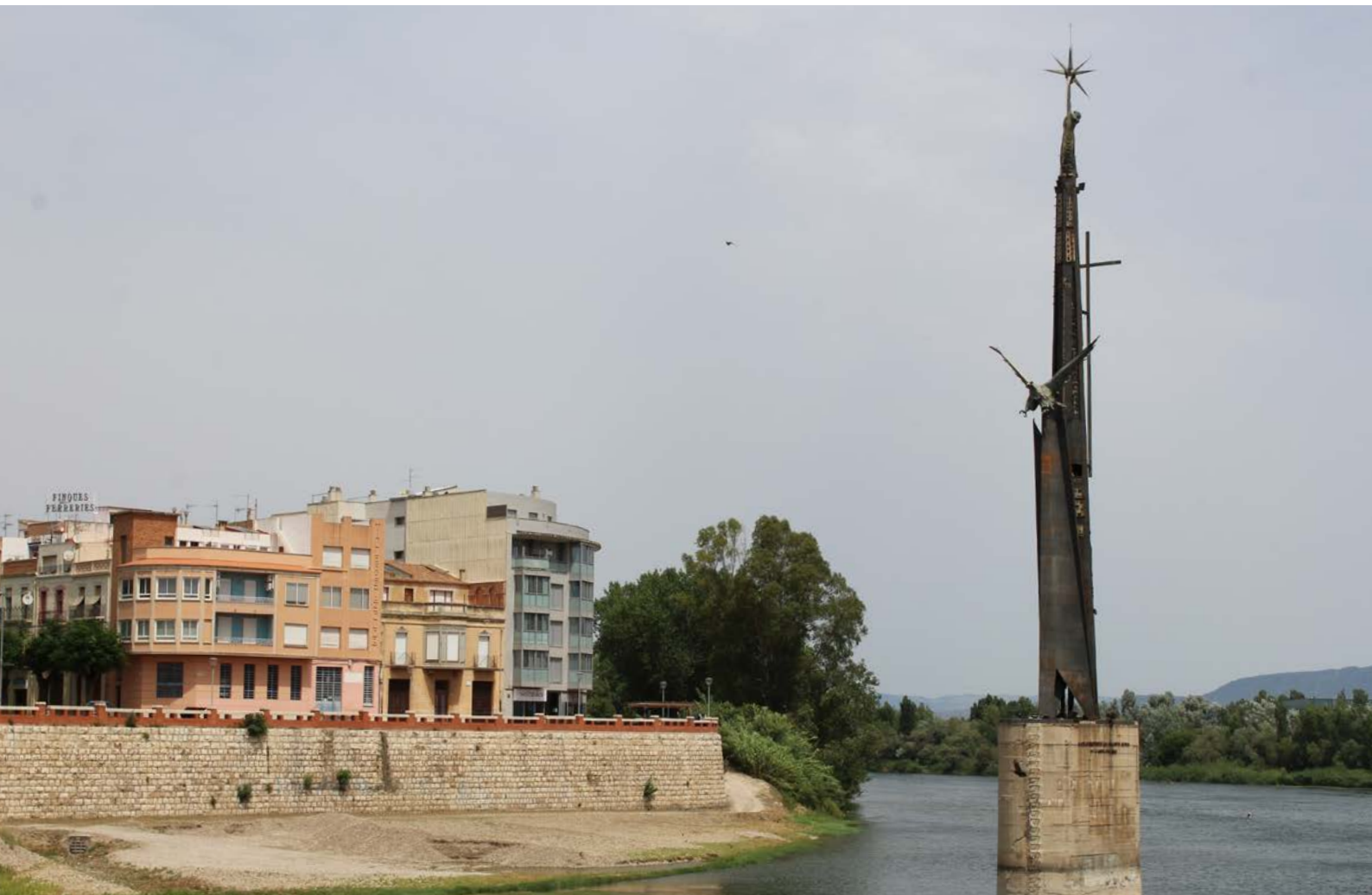
Monument franquista a Tortosa.

Martínez-Gayo, G. i Valls, R. (2022, 13 de desembre). Turismes i memòria: idees i propostes per avançar cap a un horitzó postcapitalista . Alba Sud.