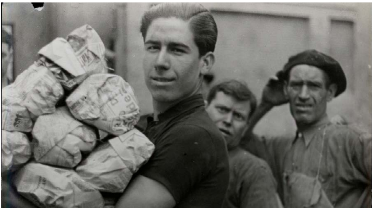
Repartiment de queviures a obrers barcelonins l'any 1938.

Després de la guerra i els primers anys de la repressió més cruenta, el règim es va assentar, encara que el recurs a la violència mai va desaparèixer. Ni tan sols la derrota en 1945 dels aliats del general Francisco Franco, Adolf Hitler a Alemanya i Benito