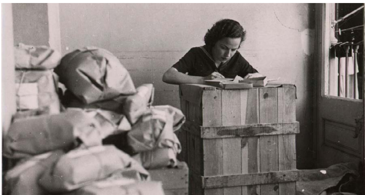
Comitè de dones antifeixistes.

de pecat original que comporta una mena de càstig diví en forma de dictadura que finalment pot ser expiat a través d'una transició “modèlica”, governada per uns dirigents prudents i bondadosos, que clourà en la reintegració d'Espanya en les democràcies