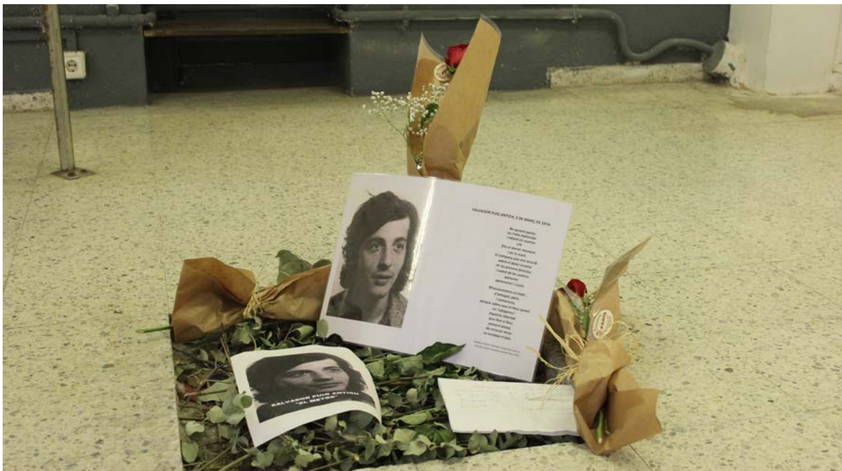
In memoriam de Salvador Puigantich, presó Model.

Xavier Riu explica com "a partir de 2015 es va crear una plataforma des de l'Associació de Veïns i Veïnes de l'Esquerra Eixample, escoles, entitats memorials, fundacions i sindicats per donar l'empenta definitiva al projecte" Tot plegat, va culminar en el seu tancament definitiu el 2017 i l'inici de la transformació de l'espai per a usos veïnals i memorials. Un any després, amb l'espai ja de titularitat municipal, es va dur a terme el procés participatiu, impulsat per l'Ajuntament de Barcelona, per definir els usos