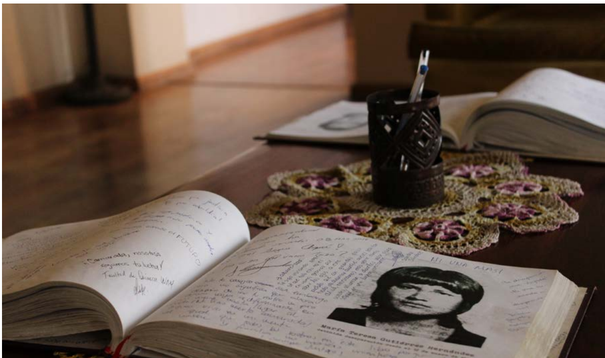
Museu Casa de la Memoria Indómita, Mèxic.