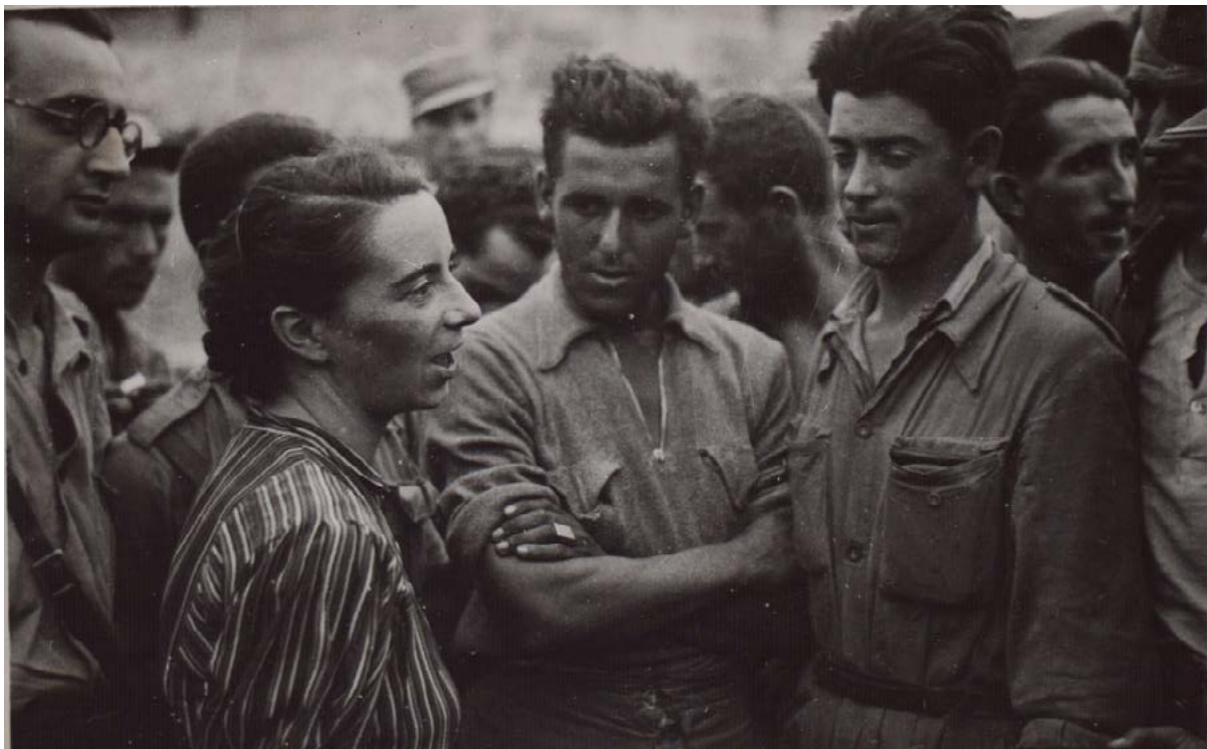
Periodista parlant amb evadits a Belchite, Saragossa.

Una de les fites importants d'aquells anys va ser la lluita per la declaració de la nul·litat dels judicis franquistes. La llei de 2007 els declarava injustos per la seva