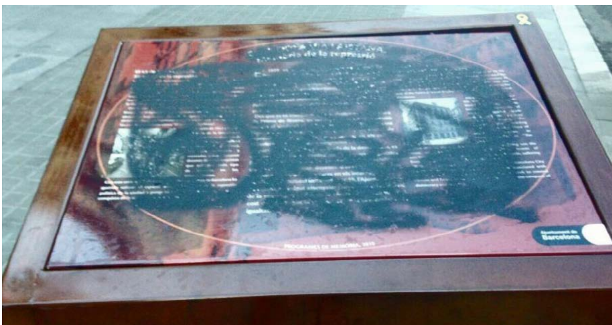
Via Laietana cartell bandalitzat.

Per tant, tots els actors implicats reconeixen una situació encara indefinida, que cal gestionar i organitzar amb cura. En un entorn turístic com és la ciutat de Barcelona és arriscat deixar que els esdeveniments vagin per lliure. El risc de massificació i pèrdua