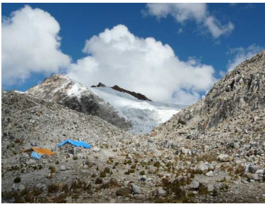
Campamento de mineros en la concesión La Fabulosa

Qala Uta , que significa Casa (Hogar) de Piedra en Aymara, es una asociación de turismo solidario comunitario de la Cordillera Real de Bolivia (Depto de la Paz).