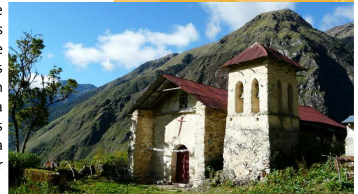
Plaza principal de Challana

Para las familias que componen Qala Uta, el turismo es un medio de seguir unidos y salir adelante , mejorando las condiciones de vida en las comunidades y frenando el éxodo rural creando nuevas fuentes de empleos, en particular para los jóvenes.