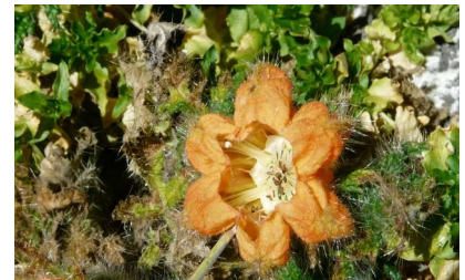
Flor de las alturas