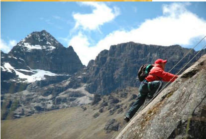
Escalada deportiva en Uma Palca

Qala Uta organiza circuitos que le llevarán a conocer las diferentes comunidades que conforman la asociación, además de descubrir este lugar único en el mundo y mágico que es la Cordillera Real de La Paz.