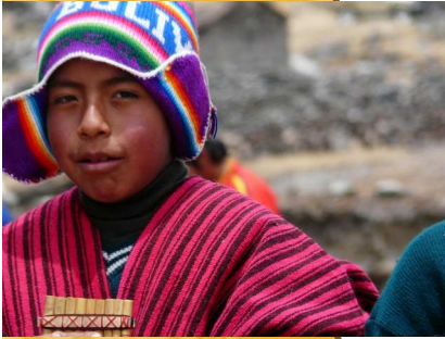
Joven Aymara de Uma Palca