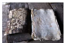
Una nueva página se ha escrito en la historia de la Red

En este espacio de información, les brindaremos nuestros consejos para viajar en nuestro país , al encuentro de las zonas rurales. También encontrarán ahí una exposición de las artesanías de las diferentes comunidades miembros de la Red Tusoco, artesanías hechas a mano valorando nuestros saberes ancestrales, objetos y tejidos que materializan de manera artística nuestras identidades y nuestras culturas vivas.