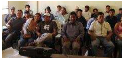
Asamblea en la nueva oficina de la Red Tusoco Calle Junín Sur 364, Cochabamba, Bolivia

En la última Asamblea General de la Red de Turismo Solidario Comunitario en abril de 2009 hemos fortalecido a niveles comercial y jurídico el turismo solidario comunitario en Bolivia, creando nuestra tour operadora.