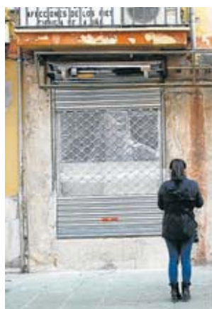
Més de 2.000 petits comerços han tancat per la crisi. I. BUJ

"Aquest PDSEC va ser anunciat fa unes setmanes pel Govern balear i el Consell de Mallorca, davant de les patronals de comerç integrades en la Confederació Balear de Comerç, CBC (Pimeco i Afedeco)", va dir ahir Pimem, que considera "una irresponsabilitat anunciar la redacció d'un pla director sense que aquest fos acompanyat de la declaració d'una moratòria". "Per Pimem, més aviat semblava una crida que es posin en marxa més projectes", criticà la patronal. ■