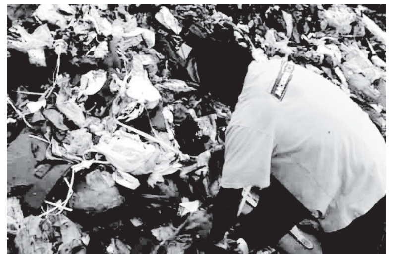
Al femer de Liberia, a Costa Rica, arriben diàriament gran quantitat d'immigrants a recuperar materials per al reciclatge. Imatge extreta del video Y me fui.