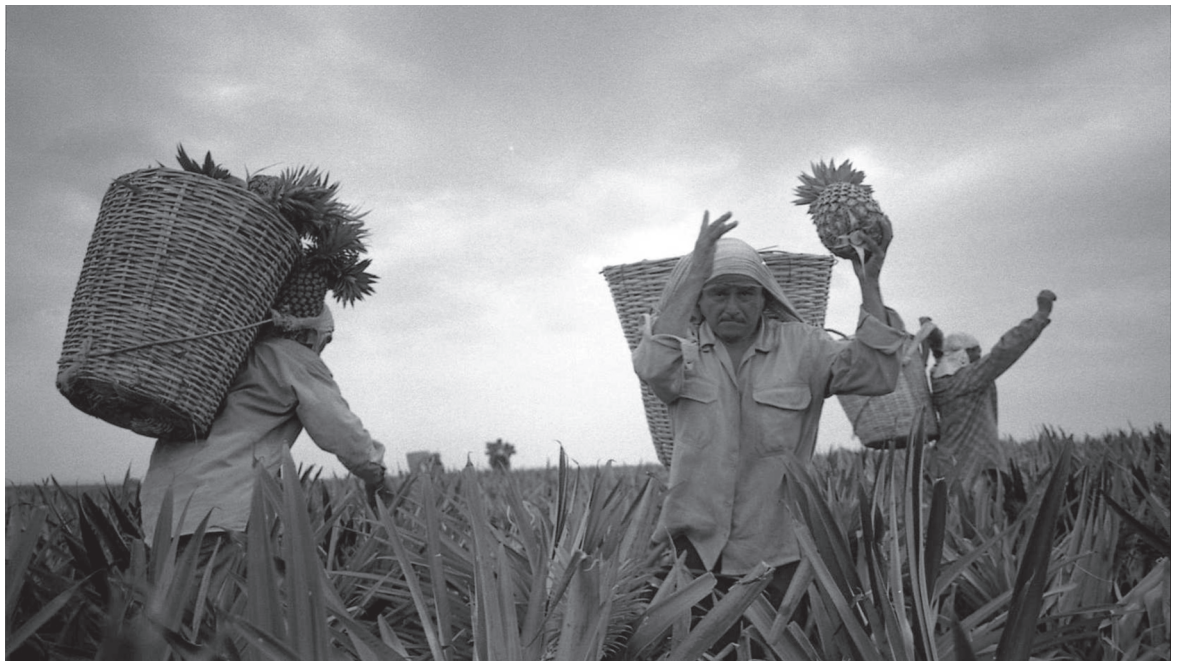
Plantació de pinya a Costa Rica. La presència d'agrotòxics i de nefrotòxics com els metalls pesats a l'ambient, a l'aigua o a la llet materna, estan relacionats amb una nova plaga a Centreamèrica que es cobra milers de vides cada any: la Insuficiència Renal Crònica.

Immerts en aquest context de precarietat, els i les immigrants nicaragüencs es veuen pressionats, a més, per l'estalvi del darrer centim: l'any 2005 enviaven remeses als seus familiars de Nicaragua per valor de 42 milions US$. Aquesta quantitat, quasi l'1% del PIB del país, és només una petita part del total de remeses rebudes per aquest país des d'Europa i, sobretot, des dels EUA – que fou de més de 600 milions US$, prop del 15% del seu