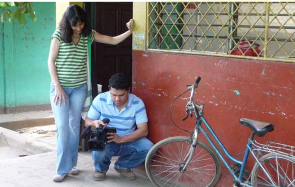
Filmación en Masaya, Nicaragua.