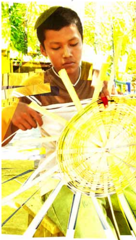
Imagen del proyecto "Nicaragua es un país de colores". Diseño gráfico: Chamba F. Acosta.