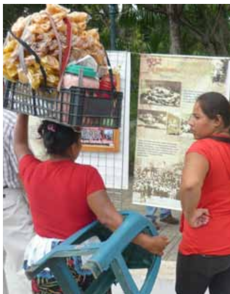
Los Izcalcos, exposición pública del Museo de la Palabra y la Imagen, San Salvador, El Salvador, enero 2010.

Museo de la Palabra y la Imagen. Memoria, identidad y cultura en El Salvador, por Ernest Cañada (Artículo núm. 2 de la Colección “Opiniones en Desarrollo - Programa Comunicación para el Desarrollo”, marzo de 2010). Artículo sobre el papel del Museo de la Palabra y la Imagen en la recuperación de la memoria histórica del pueblo salvadoreño y la reconstrucción de su identidad cultural, a partir de la salvaguarda de registros documentales de diferentes orígenes y formatos (audiovisuales, fotografías, manuscritos, objetos, ...) que permite la investigación y la difusión y debate público. Este artículo ha sido realizado en el marco de un proyecto gestionado por la Asociación Eualter y ALBA SUD con el apoyo de la Agencia Catalana de Cooperación al Desarrollo. Publicado también en la revista Envío, de Nicaragua, bajo el título “Derecho a la memoria” (núm. 338, mayo de 2010). Disponible en: http://www.envio.org.ni/ (castellano) y http://www.envio.org.ni/articulo/4184 (inglés).