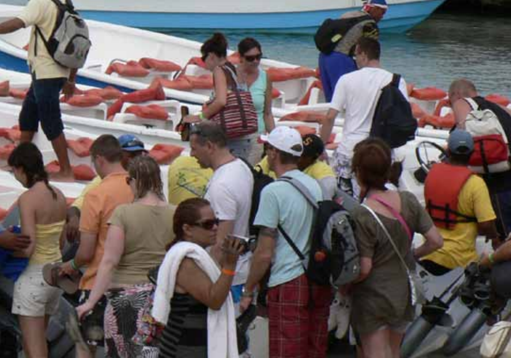
Bávaro, República Dominicana.

Conferencia sobre “Justicia climática y turismo” en el encuentro “Enlazando Alternativas IV”, Universidad Complutense, Madrid, 15 de mayo de 2010. A cargo de Joan Buades.