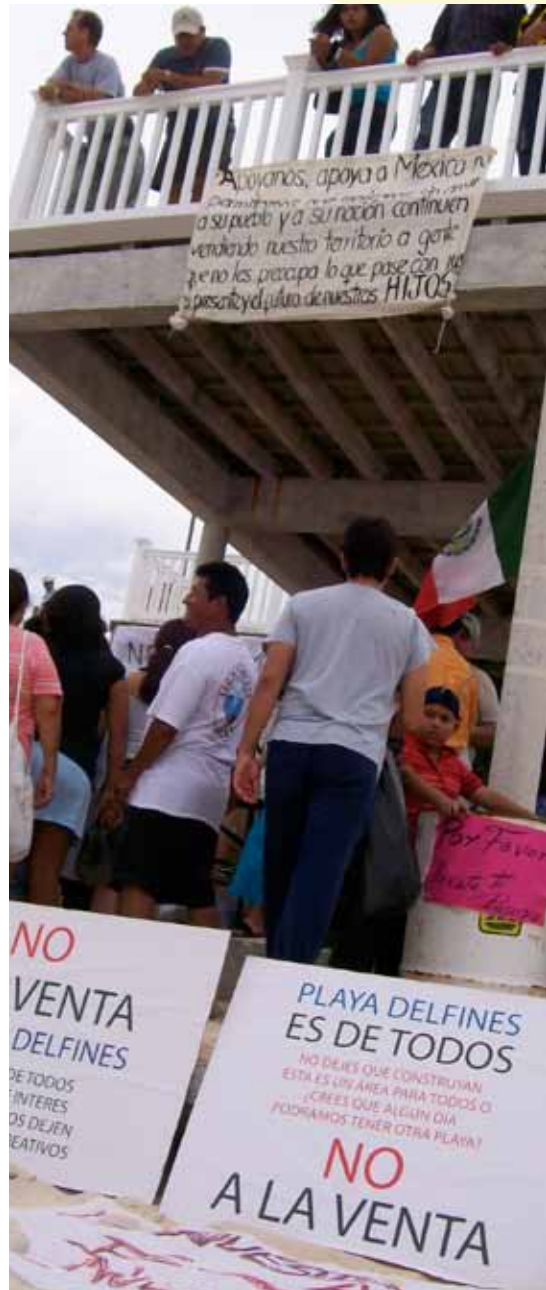
Protesta por la privatización de Playa Delfines, Cancún, México