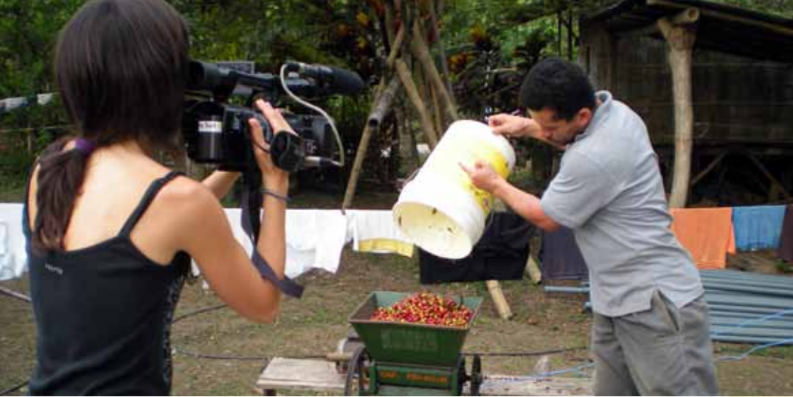
Filmación en Ecuador.